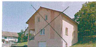
Pour mettre en valeur l'architecture de la construction, le projet coloré doit avoir du sens. La couleur souligne les éléments qui composent la façade : les menuiseries, les volets, les portes, les garde-corps, les dessous de toit, etc.

Pour les constructions antérieures à 1960, des nuanciers spécifiques proposent une palette de teintes plus adaptée aux différentes typologies de patrimoine (ferme, villa, demeure urbaine, cité ouvrière...). Plutôt que l'usage de ce nuancier général, adapté à tous les types de bâtis et plus particulièrement aux constructions contemporaines, il est recommandé de se reporter au nuancier de la typologie de bâti concerné.